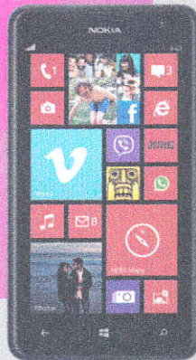
NOKIA LUMIA 625